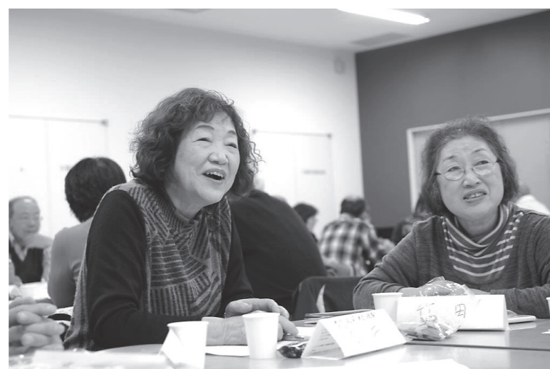
分散会で、ホンネで話して「そう、そう」と笑顔で交流

時を置いてくると、汗の中にも皮膚再生に必要な材料がこぼれ落ちて、これをカバーしてあげると、乾燥しにくいように保つ性質があります。ケガをしたら、消毒せず、創部の砂などの異物を流水で洗い流し、こわった高機能絆創膏を使いましょう。