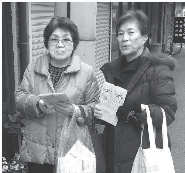
週一回の支部行動日を設けて訪問行動

大腸がん検診は「捨てるうんちで拾ういのち」身体に負担のかからない検査です。 地域から手遅れの患者を出さないために、ぜひ受診してください。