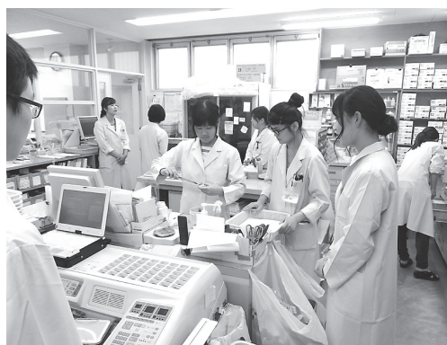
毎年「高校生1日薬剤師体験」を、レインボー薬局

で行っています。今年も8月に2回、9名の高校生が訪れ、レインボー薬局で体験、コープおおさか病院薬剤部も見学しました。「薬剤師さんが実際に働いている姿を見たり、体験できて、すごく楽しかった。薬剤師になりたい思いが強くなりました。ありがとうございました。等」の感想が寄せられています。